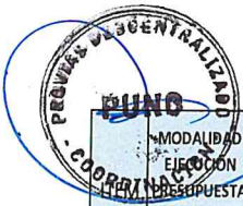
Tabla 7: MATRIZ SEGUIMIENTO EJECUCION FISICA DE OBRA

Analizar y describir lo desarrollado en el Matriz