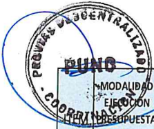
Tabla 7: MATRIZ SEGUIMIENTO EJECUCION FISICA DE OBRA

Analizar y describir lo desarrollado en el Matriz