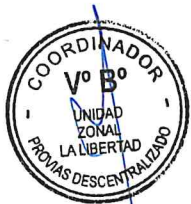
Tabla 2: MATRIZ SEGUIMIENTO DATOS TECNICOS

Analizar y describir lo desarrollado en la Matriz