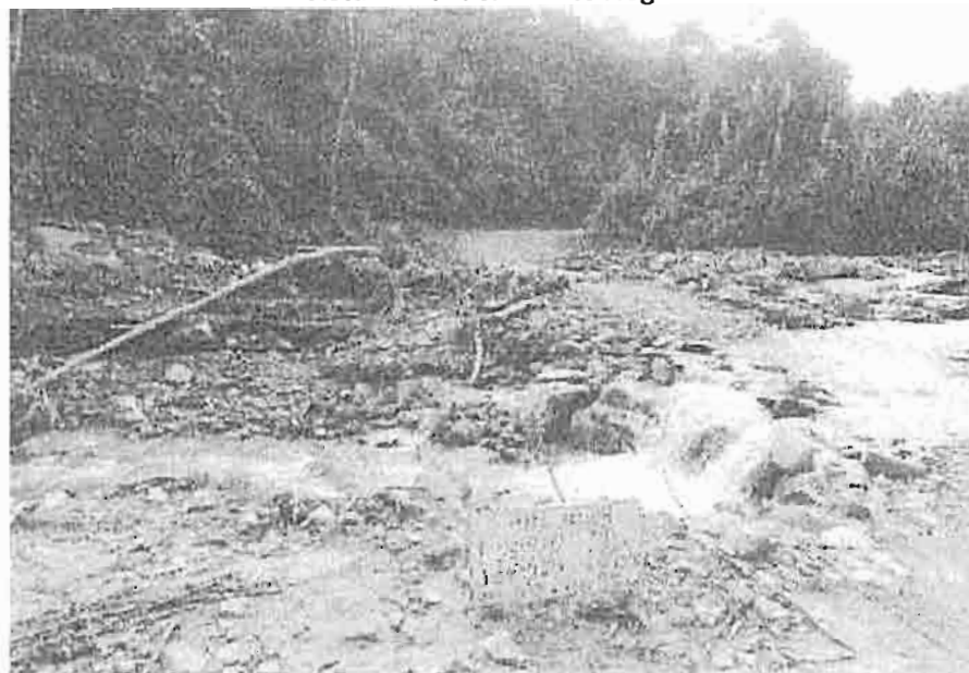
Vista actual del Puente Nogalini

El puente se encuentra ubicado sobre el río Nogalini, en el camino vía vecinal Emp. San Juan del Oro – CP Yanamayo – Sector Nogalini – IES Nogalini, ubicado en el distrito de San Juan del Oro, provincia de Sandia, departamento de Puno.