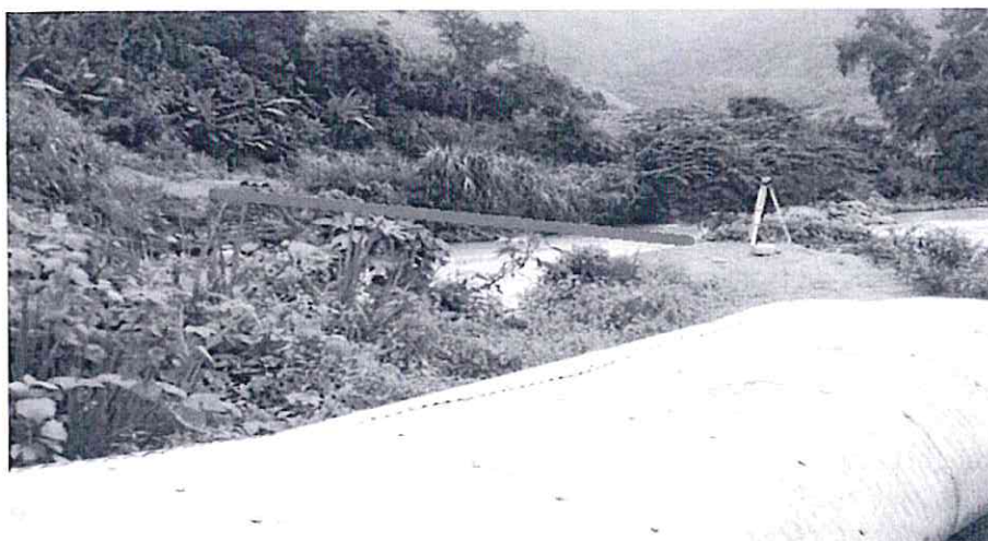
Vista del estado actual del Sector "La Palma"

La ruta para llegar a la zona del proyecto, desde la ciudad de Lima se toma la carretera PE-1N hasta la ciudad de Sullana con una distancia de 1010 kilómetros, posteriormente se toma la carretera PE-1NL hasta el sector de Sajino con un trayecto de 90 kilómetros en este lugar se da inicio a la carretera PE-1NT hasta el Puente Paraje con un recorrido de 38 kilómetros, se continua con el camino PI-635 de trocha hasta el desvío La Palma con un trayecto de 13.70 kilómetros y concluye con el camino de trocha de una longitud de 500 metros. Teniendo un total del trayecto de 1152.2 kilómetros.