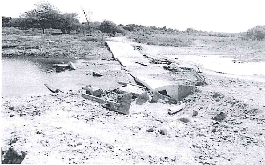
Vista de la zona donde se proyecta el puente "Malingas"