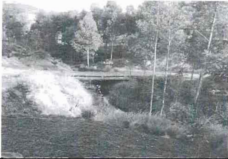
Fotog. 01: Puente Pachachaca y sus accesos