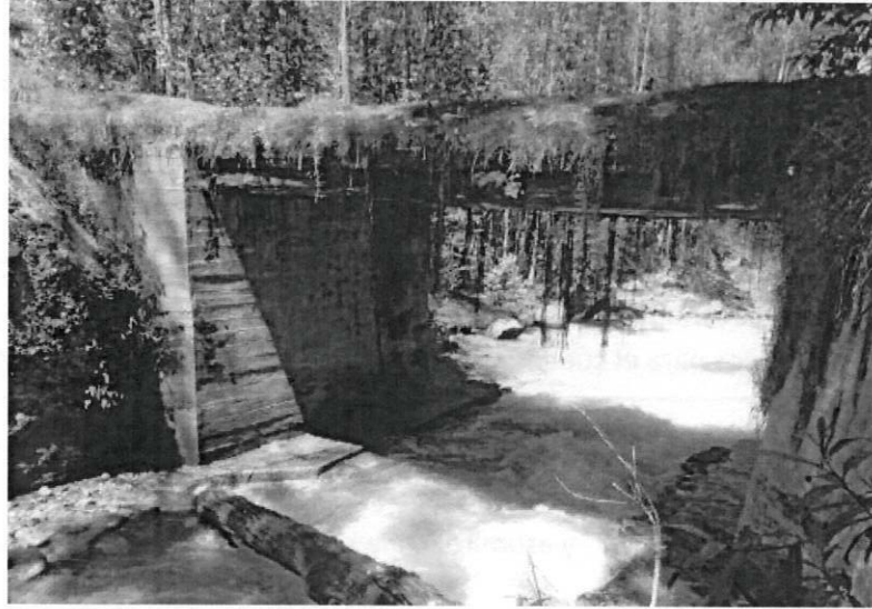
Fotog. 01: Estado actual del puente de madera - Congar