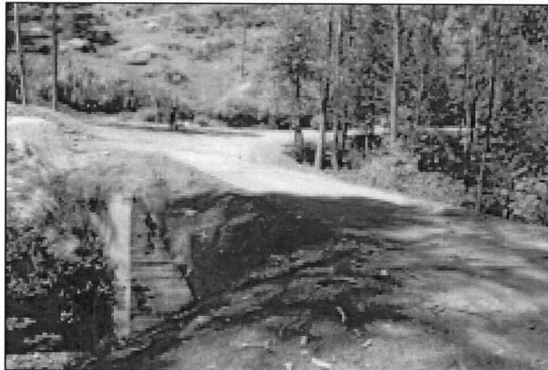
Fotog. 02: Condiciones del entorno de la Zona de la ubicación del puente Congar.