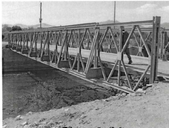
Fig. N°01: Puente Los Arabes