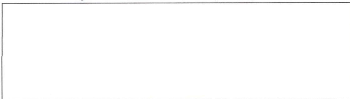
Imagen N°01 : Ubicación del Puente ( nombre )