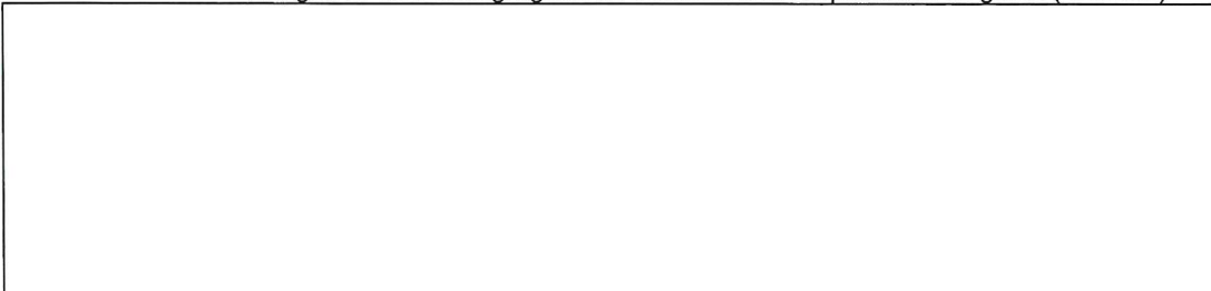
Imagen N°06 : Desagregado de acuerdo a las específicas de gasto ( nombre)