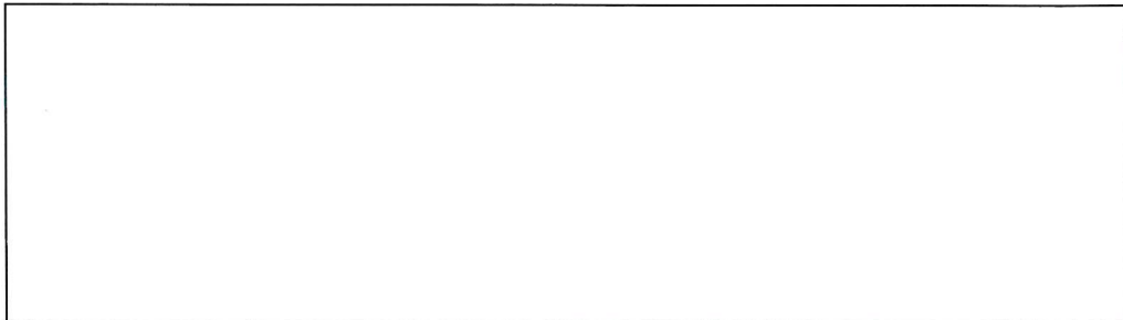
Imagen N°05 : Incorporación de recursos del puente ( nombre)

3.12 De la revisión en el aplicativo Consulta Amigable (XX.09.2024), se aprecia que la Municipalidad, incorporó sus recursos asignados correctamente según la cadena programática correspondiente.